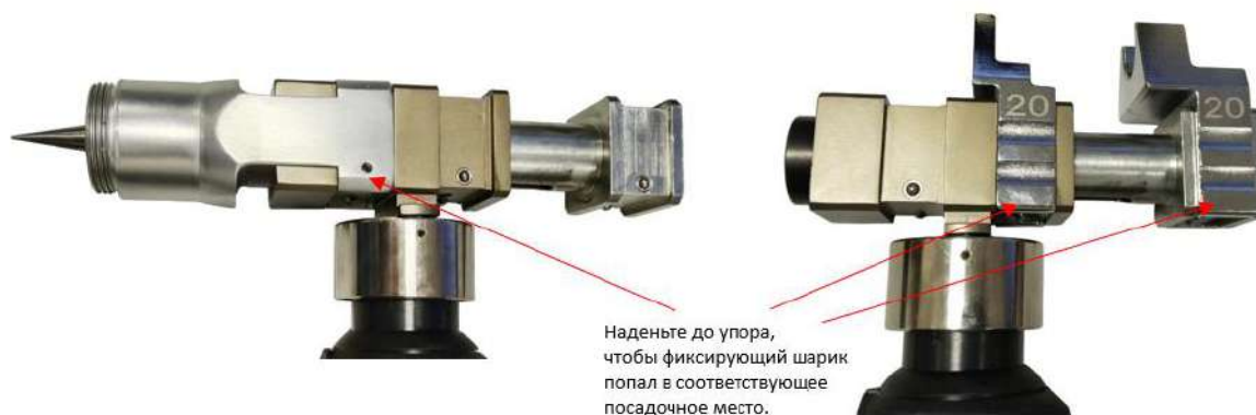
Рис. 1 Правильная установка расширительного адаптера и запрессовочных тисков на аксиальном прессе

Внимание! Во избежание поломки расширительного адаптера и запрессовочных тисков, убедитесь, что они установлены правильно на аксиальном прессе (Рис.1). Они должны быть зафиксированы в соответствующих пазах при помощи утапливаемых стальных шариков. Неправильная установка ведет к деформации и последующей поломке расширительного адаптера и запрессовочных тисков.